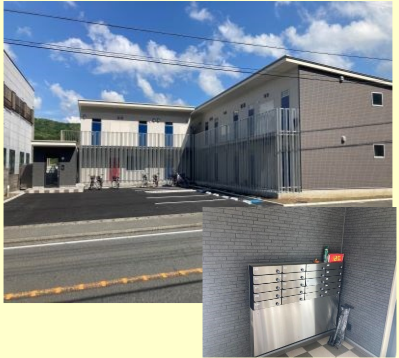
オートロック、宅配ボックスなどセキュリティ完備