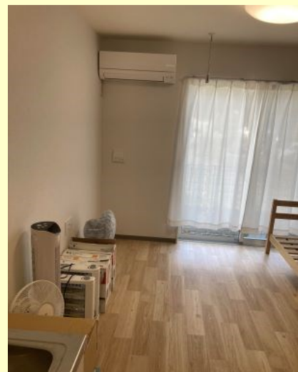
完全個室・フローリング・駅チカで生活も便利